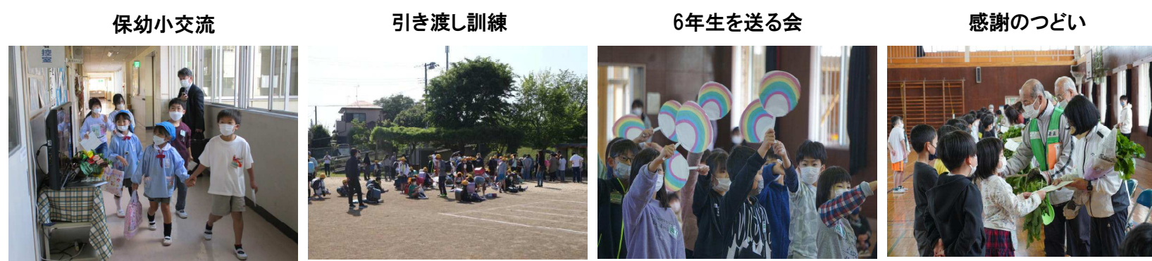
保幼小交流 引き渡し訓練 6年生を送る会 感謝のついで