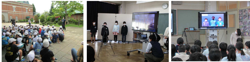
シャッターカメラの学習からワイン産地でつながる山梨とのオンライン交流学習へ